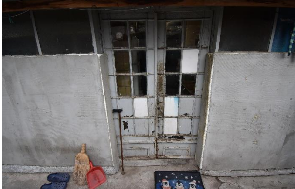
Vedere interior proprietate subiect – C1: