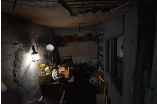
Vedere proprietate subiect – C3: