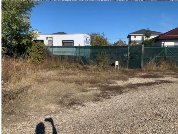
Vedere proprietate subiect – CF 30489 (drum de acces):