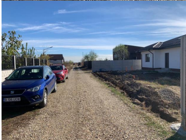
Vedere proprietate subiect – CF 30468 (drum de acces):