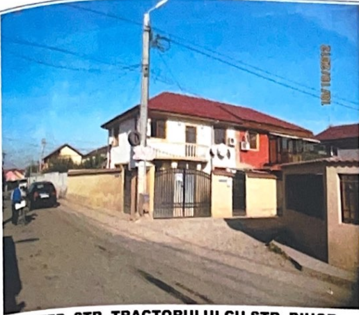
INTER. STR. TRACTORULUI CU STR. BIHOR