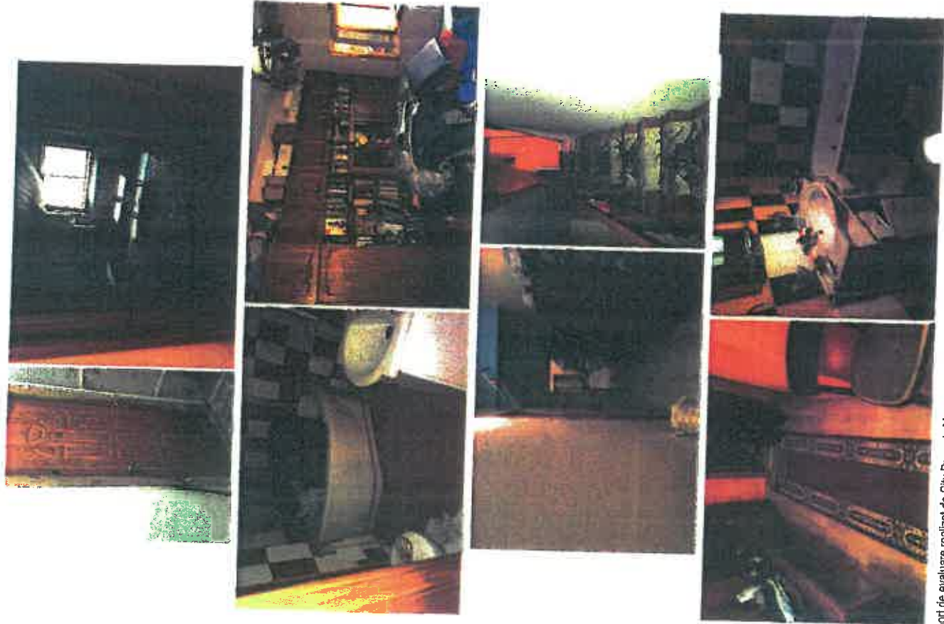
C2 - Locuinta