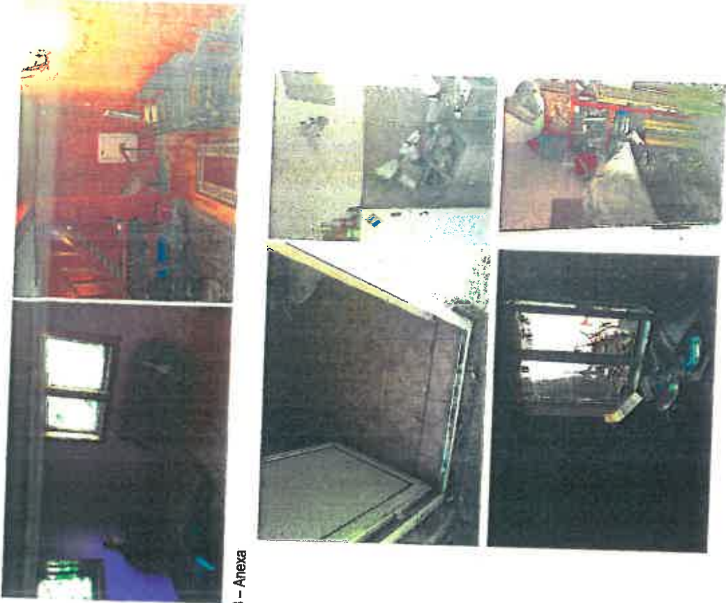
C3 - Anexa