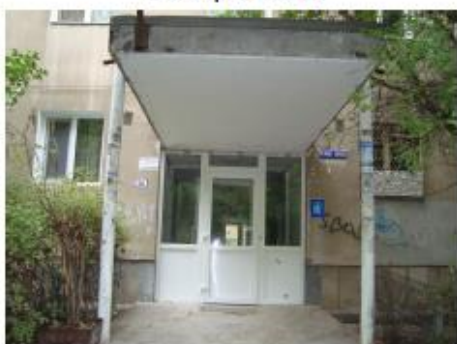
Acces principal scara 5