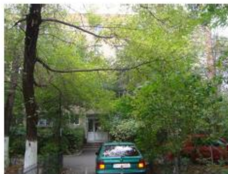
Vedere spre scara 5, bloc F3