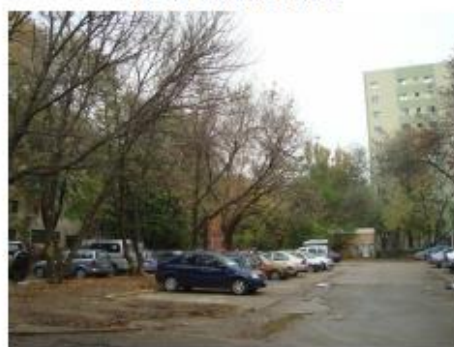
Vedere spre blocul F3 si vecinatati