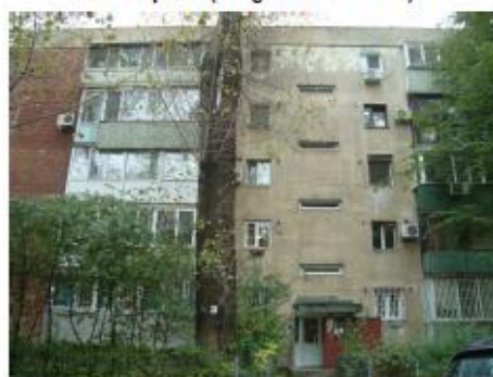
Acces secundar scara 5