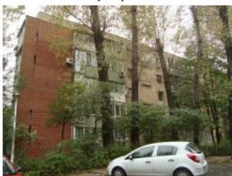
Vedere spre imobil - latura secundara