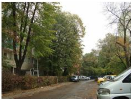
Vedere spre blocul F3