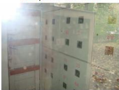
Contoarele electrice (ap. 86)