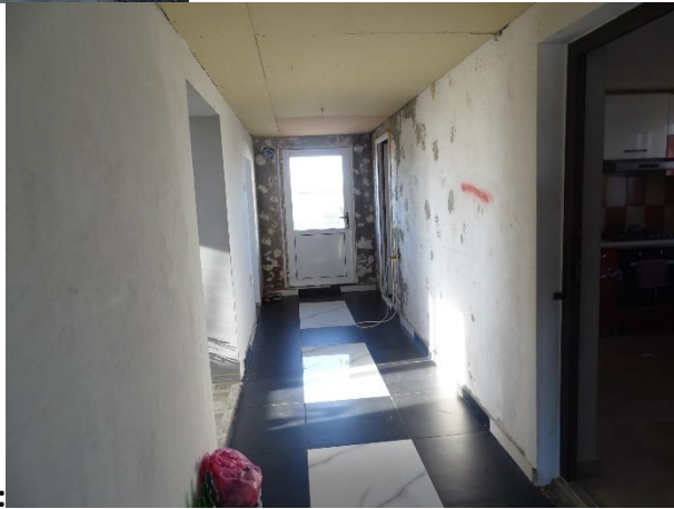
Vedere interior proprietate subiect: