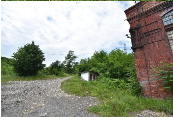
C1 – Clădire anexă