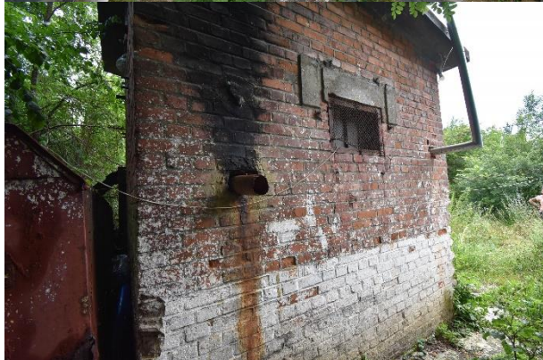
C2 – WC